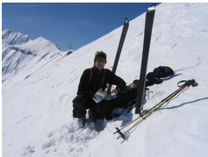
Sortie du 13.02.2'010 au Cheval Blanc